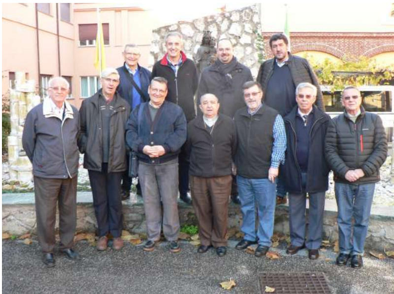
Grupo de los ESPAÑOLES Y PORTUGUESES en el patio de la casa noviciado de Genzano.