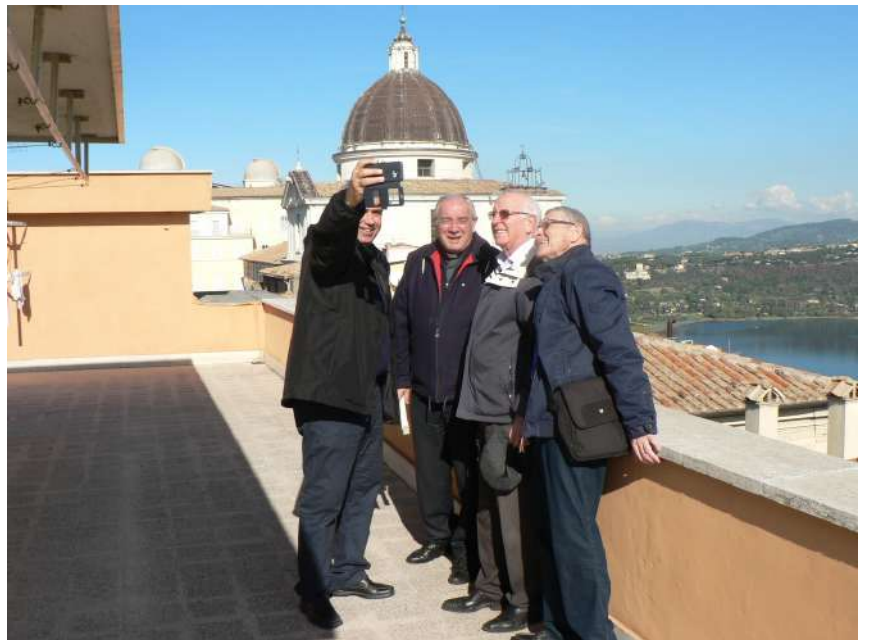
En la terraza de las casa de los Salesianos de Castelgandolfo, con el lago volcánico detrás.