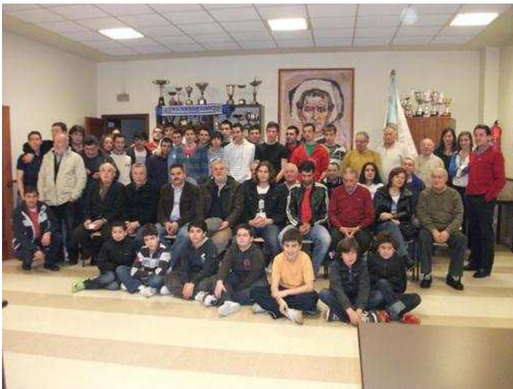
Invitados y miembros de la Peña Deportivista en la sede de la Asociación de Antiguos Alumnos