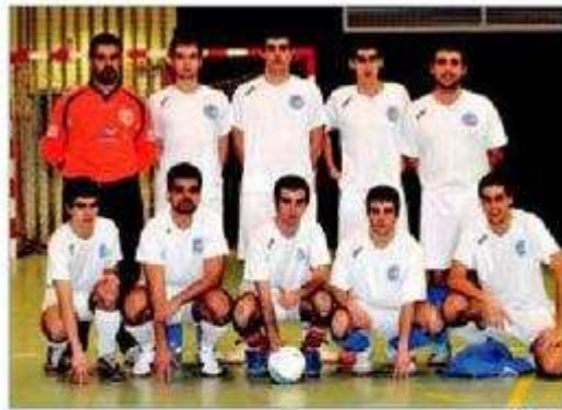
Don Bosco B realizó una excelente campaña en Segunda División JOSÉ SÁNCHEZ

De esta manera, el Bosco B lleno de ilusión, garra y un espíritu en Don Bosco de lucha y entrega, tan solo ha cedido 3 empates en toda una temporada que pondrá su broche con la interesante disputa del citado Teresa Herrera y, como no, con la IV edición del Trofeo Benéfico María Auxiliadora, donde parte como favorito y espera llevarse el gato al agua una vez más.